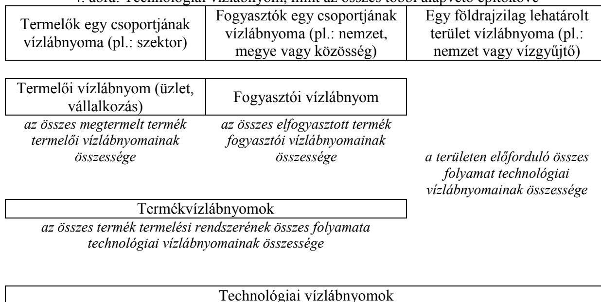
4. ábra: Technológiai vízlábnyom, mint az összes többi alapvető építőköve